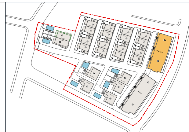
PLANI I VENDOSJES SE APARTAMENTEVE SH 1: 750